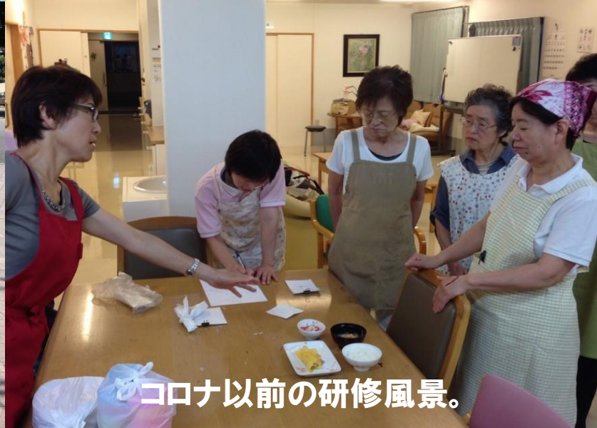
コロナ以前の研修風景。